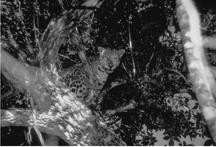
Figura 2. Un jaguar macho (Tony) con radiocollar en nuestro sitio de estudio (marzo de 1999).